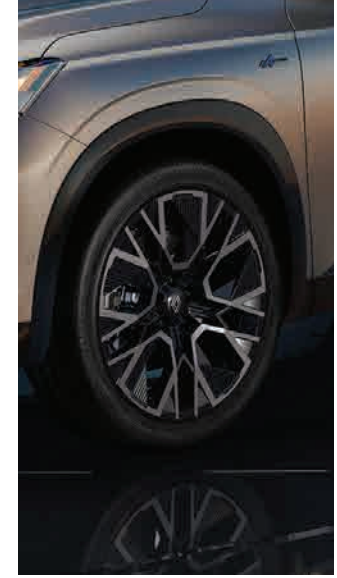
20" Alpine altitude twin color alloy wheels جنوط رياضية ثنائية اللون مقاس ٢٠ بوصة