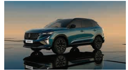
naxos blue with diamond black roof*