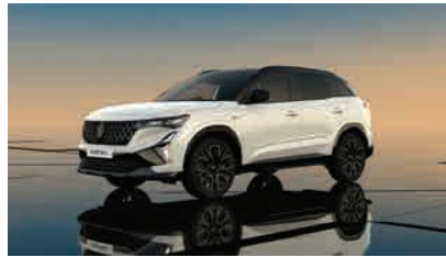
arctic white with diamond black roof*