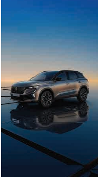
new Renault Austral رينو أوسترال الجديدة