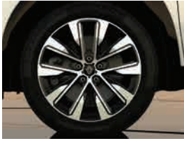
19" komah diamond-cut alloy wheel rim (1) جنوط رياضية ثنائية اللون مقاس ١٩ بوصة (1)