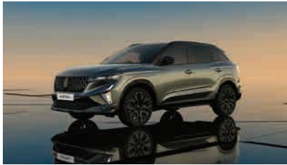
schist grey with diamond black roof*