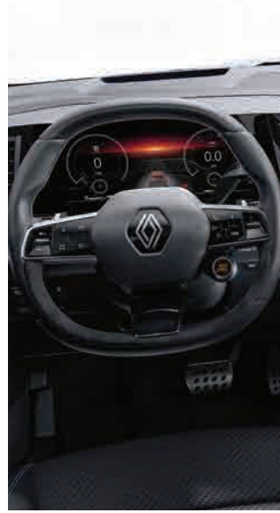
Alcantara steering wheel with leather inserts عجلة قيادة من الكاترا والجلد