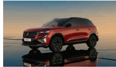
flame red with diamond black roof*