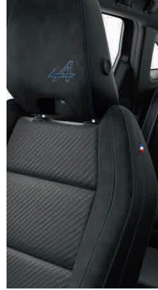
Alcantara ergonomic seats with leather inserts مقاعد رياضية من الكاترا والجلد