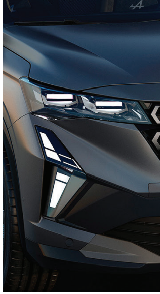
full LED headlamps نظام إضاءة LED متكامل للمصابيح الأمامية