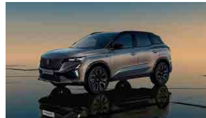
shadow grey matte with diamond black roof*