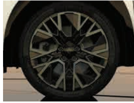
20" Alpine altitude smokey grey diamond-cut alloy wheel rim (2) جنوط رياضية ثنائية اللون مقاس ٢٠ بوصة (٢)

(1) available as standard on techno and iconic versions.