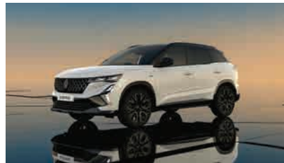
white matte with diamond black roof*