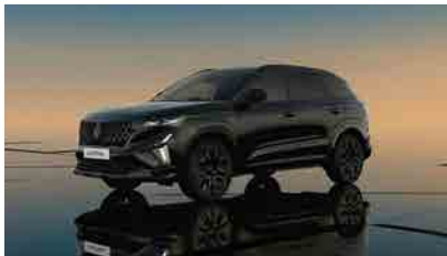
starry black with diamond black roof*