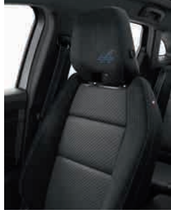
mixed carbon fabric / Alcantara® upholstery / blue top-stitching (2) مقاعد رياضية من الكانترا والجلد (٢)

(1) available as standard on techno and iconic versions.