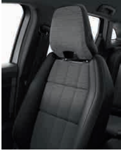
mixed imitation leather / gradient grey fabric (1) upholstery مقاعد جلد مع قماش (1)