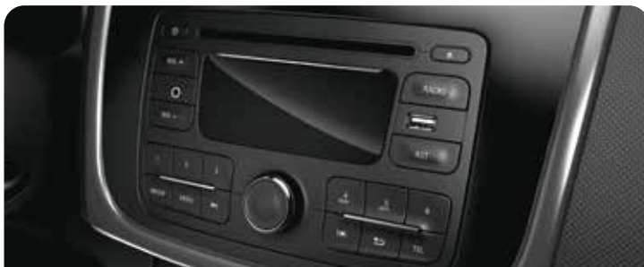
RADIO CD, MP3, USB, AND AUX