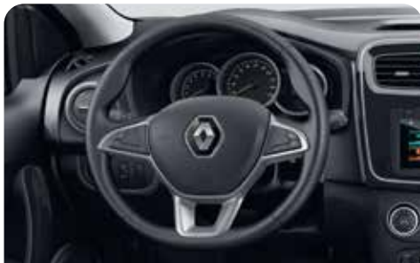
ELECTRIC POWER STEERING