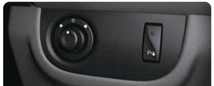
REAR PARKING SENSOR