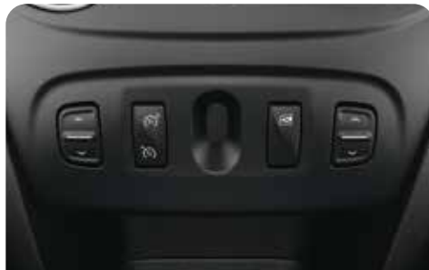
CRUISE CONTROL & SPEED LIMITER