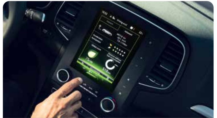
R-LINK 2 SYSTEM, 8.7" TOUCH SCREEN