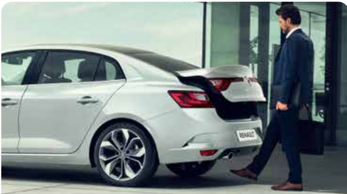
EASY TRUNK ACCESS