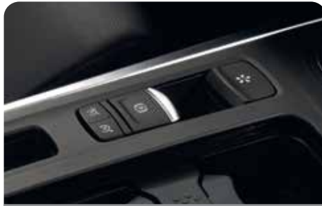
ELECTRIC PARKING BRAKE