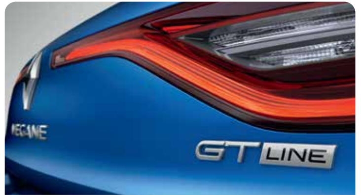
OUTSIDE GT LINE PACKAGE