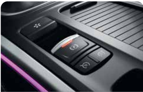
ELECTRIC PARKING BRAKE