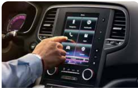
R-LINK 2, 8.7" TOUCHSCREEN