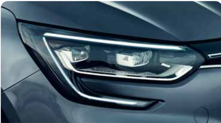
C-SHAPE LED DAYTIME RUNNING LIGHTS