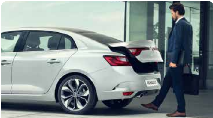
EASY TRUNK ACCESS